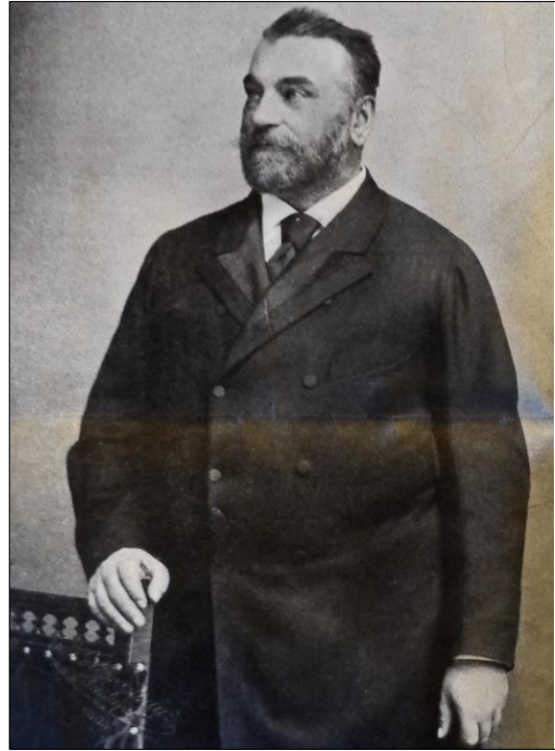
Szilágyi Dezső (1889–1895)